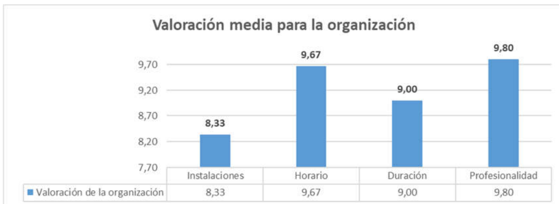
Figura 2. Gráfico de las valoraciones medias respecto a los aspectos organizativos.

A continuación, se presentan los valores medios de cada ítem: