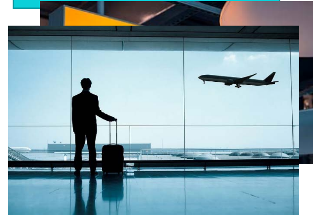
Negocios y motivos profesionales

¿Has realizado alguna vez algún viaje por motivos personales? Cuéntanos tu viaje y de qué tipo fue, es decir si fue un viaje por salud, para visitar a algún familiar o simplemente para un viaje de formación.