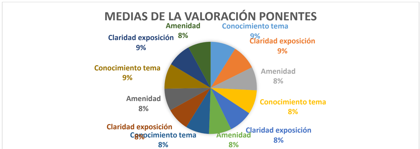
Gráfico 3. Puntuación de las ponencias.

Los objetivos fundamentales plan de desarrollo turístico de Manabí.