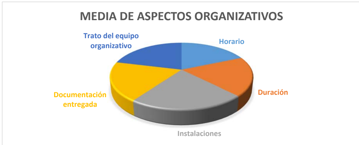
Gráfico 4. Aspectos organizativos

Algunos de los comentarios recogidos en las encuestas de satisfacción: